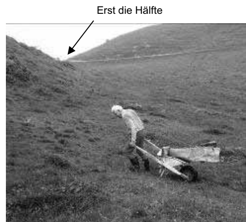
Der Weg zur Mulde ist weit !